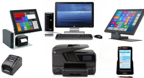
Figure 1 Vous pouvez tirer bénéfice du matériel...

L'expression « technologies de l'information et de la communication » recouvre à la fois une large gamme de différents dispositifs d'accès tels qu'ordinateurs de bureau, ordinateurs portables, téléphones mobiles, smartphones, tablettes, projecteurs, imprimantes, scanners, appareils photo numériques, de même que les logiciels, applications et ressources numériques qui permettent d'en faire usage. Certains d'entre eux peuvent être utilisés sans connexion, avec un système d'exploitation et des logiciels appropriés ; d'autres peuvent être connectés à Internet. On constate que les dispositifs mobiles se répandent très rapidement en Afrique, et qu'ils constituent un moyen privilégié d'accès à l'Internet, notamment pour les populations qui n'ont pas les moyens d'acheter un ordinateur. Il est donc important que vous preniez en considération cette tendance croissante. Plus largement, en tant que chef.fe d'établissement, il est souhaitable que vous vous teniez informé.e des développements technologiques et que vous identifiiez la manière dont ils pourraient améliorer les enseignements-apprentissages dans votre école.