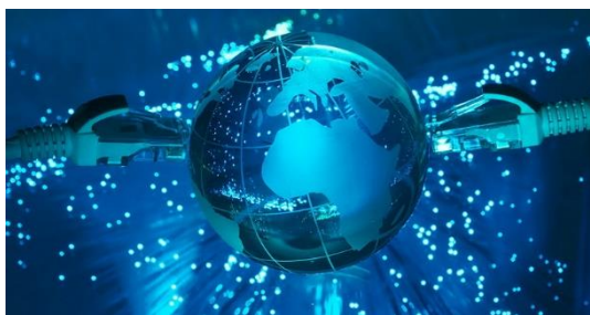
Figure 2... et accéder à l'Internet

L'Internet constitue une ressource fabuleuse. L'accès à Internet à l'école ouvre aux enseignant.e.s et aux élèves l'accès à des opportunités d'apprentissage quasiment illimitées. Même si l'Internet n'est pas disponible dans votre établissement, vous pouvez télécharger des ressources en dehors, sur une clé USB, ou sur un terminal mobile, puis les transférer sur un ordinateur de l'établissement, et exploiter ces ressources en local (hors connexion). Même si l'internet est parfois difficilement accessible en dehors des zones urbaines, il est de plus en plus facile de disposer de téléphones intelligents ou de tablettes équipées d'une carte SIM, ou encore de recourir à des clés rechargeables 3G ou 4G.