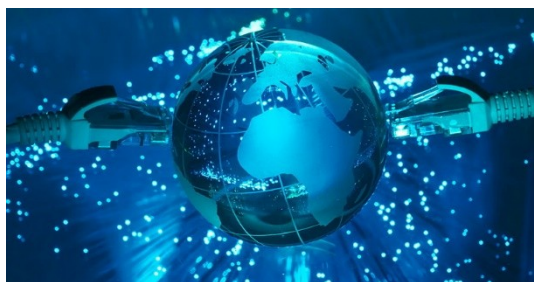
Figure 2... et accéder à l'Internet

L'Internet constitue une ressource fabuleuse. L'accès à Internet à l'école ouvre aux enseignant.e.s et aux élèves l'accès à des opportunités d'apprentissage quasiment illimitées. Même si l'Internet n'est pas disponible dans votre établissement, vous pouvez télécharger des ressources en dehors, sur une clé USB, ou sur un terminal mobile, puis les transférer sur un ordinateur de l'établissement, et exploiter ces ressources en local (hors connexion). Même si l'internet est parfois difficilement accessible en dehors des zones urbaines, il est de plus en plus facile de disposer de téléphones intelligents ou de tablettes équipées d'une carte SIM, ou encore de recourir à des clés rechargeables 3G ou 4G.