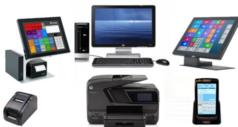
Figure 1 Vous pouvez tirer bénéfice du matériel...

L'expression «technologies de l'information et de la communication» recouvre à la fois une large gamme de différents dispositifs d'accès tels qu'ordinateurs de bureau, ordinateurs portables, téléphones mobiles, smartphones, tablettes, projecteurs, imprimantes, scanners, appareils photo numériques, de même que les logiciels, applications et ressources numériques qui permettent d'en faire usage. Certains d'entre eux peuvent être utilisés sans connexion, avec un système d'exploitation et des logiciels appropriés; d'autres peuvent être connectés à Internet. On constate que les dispositifs mobiles se répandent très rapidement en Afrique, et qu'ils constituent un moyen privilégié d'accès à l'Internet, notamment pour les populations qui n'ont pas les moyens d'acheter un ordinateur. Il est donc important que vous preniez en considération cette tendance croissante. Plus largement, en tant que chef.fe d'établissement, il est souhaitable que vous vous teniez informé.e des développements technologiques et que vous identifiiez la manière dont ils pourraient améliorer les enseignements-apprentissages dans votre école.